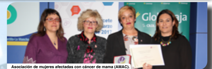
Asociación de mujeres afectadas con cáncer de mama (AMAC).