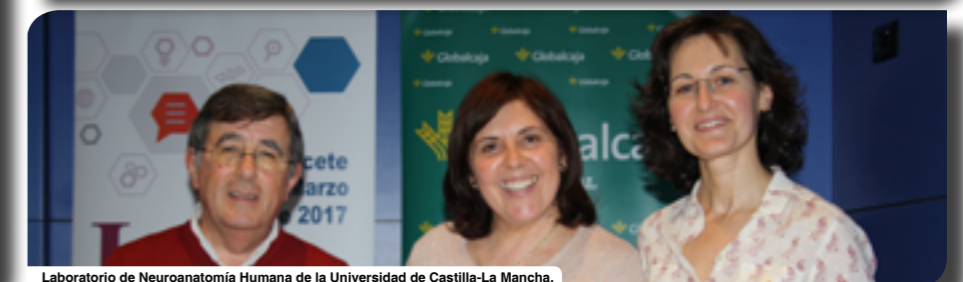
Laboratorio de Neuroanatomía Humana de la Universidad de Castilla-La Mancha.