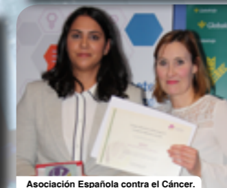
Asociación Española contra el Cáncer.