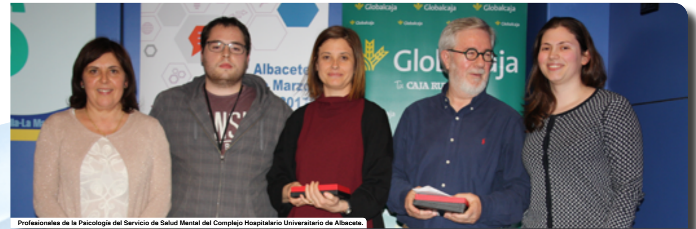
Profesionales de la Psicología del Servicio de Salud Mental del Complejo Hospitalario Universitario de Albacete.