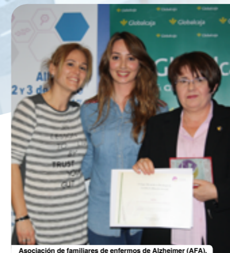
Asociación de familiares de enfermos de Alzheimer (AFA).

e intervención psicológica en la provincia de Albacete, y su participación en el desarrollo y dinamización de los equipos multidisciplinares del Servicio de Salud Mental. El COPCLM también otorgó una distinción al Laboratorio de Neuroanatomía Humana de la Universidad de Castilla-La Mancha, por su apoyo, participación e implicación a la hora de establecer líneas de colaboración entre la Universidad Regional y el colegio en materia de formación.